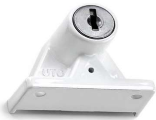
Montera in fönsterlås